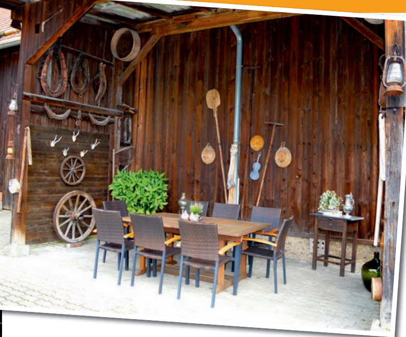
Zum gemütlichen Verweilen lädt die rustikal gestaltete Hofscheune ein.

– ebenso wie auf das gute, harmonische Miteinander der Bewohner innerhalb der Hausgemeinschaften aber auch zwischen den beiden Wohnanlagen. „Ich vermiete die Wohnungen nur an umgängliche, freundliche und kontaktfreudige Leute, die in das Niveau des Hauses passen“, betont er. Im Mietpreis sind kleine Dienstleistungen und Hausmeisterarbeiten enthalten. Auch ein Hol- und Bringservice von Einkäufen wird organisiert. Als besonderen Service hilft man bei der Beantragung von Pflegegraden. Für Pflege, Pflegefragen oder zur Überwindung bürokratischer Hürden steht ein Pflegefachdienst zur Verfügung, dessen Angebote die Bewohner in Anspruch nehmen können, aber nicht müssen. Wolfersdorf bietet dabei alles, was man sich für einen sorgenfreien Lebensabend nur wünschen kann. Eingebettet in eine idyllische Lage verfügt der Ort über schöne markierte Wanderwege direkt vor der Haustür sowie eine sehr gute Infrastruktur mit Bahn- und Busanschlüssen. Ein Hausarzt befindet sich in unmittelbarer Nähe. Zum Industriegebiet in Stockheim mit vielen Einkaufsmöglichkeiten sind es lediglich 800 Meter.