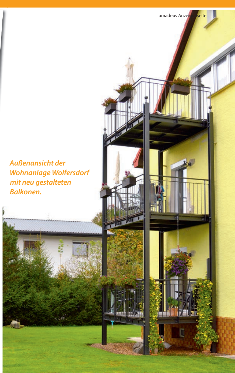
Außenansicht der Wohnanlage Wolfersdorf mit neu gestalteten Balkonen.

– ebenso wie auf das gute, harmonische Miteinander der Bewohner innerhalb der Hausgemeinschaften aber auch zwischen den beiden Wohnanlagen. „Ich vermiete die Wohnungen nur an umgängliche, freundliche und kontaktfreudige Leute, die in das Niveau des Hauses passen“, betont er. Im Mietpreis sind kleine Dienstleistungen und Hausmeisterarbeiten enthalten. Auch ein Hol- und Bringservice von Einkäufen wird organisiert. Als besonderen Service hilft man bei der Beantragung von Pflegegraden. Für Pflege, Pflegefragen oder zur Überwindung bürokratischer Hürden steht ein Pflegefachdienst zur Verfügung, dessen Angebote die Bewohner in Anspruch nehmen können, aber nicht müssen. Wolfersdorf bietet dabei alles, was man sich für einen sorgenfreien Lebensabend nur wünschen kann. Eingebettet in eine idyllische Lage verfügt der Ort über schöne markierte Wanderwege direkt vor der Haustür sowie eine sehr gute Infrastruktur mit Bahn- und Busanschlüssen. Ein Hausarzt befindet sich in unmittelbarer Nähe. Zum Industriegebiet in Stockheim mit vielen Einkaufsmöglichkeiten sind es lediglich 800 Meter.