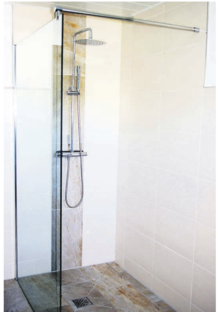
Ebenerdige Dusche - ideal für Senioren.

kompletten Rundumbetreuung und dem Gefühl von Geborgenheit und Sicherheit. Für sein Vorhaben hat er bereits den idealen Standort gefunden. Weitere Infos erfolgen zu gegebener Zeit. hs