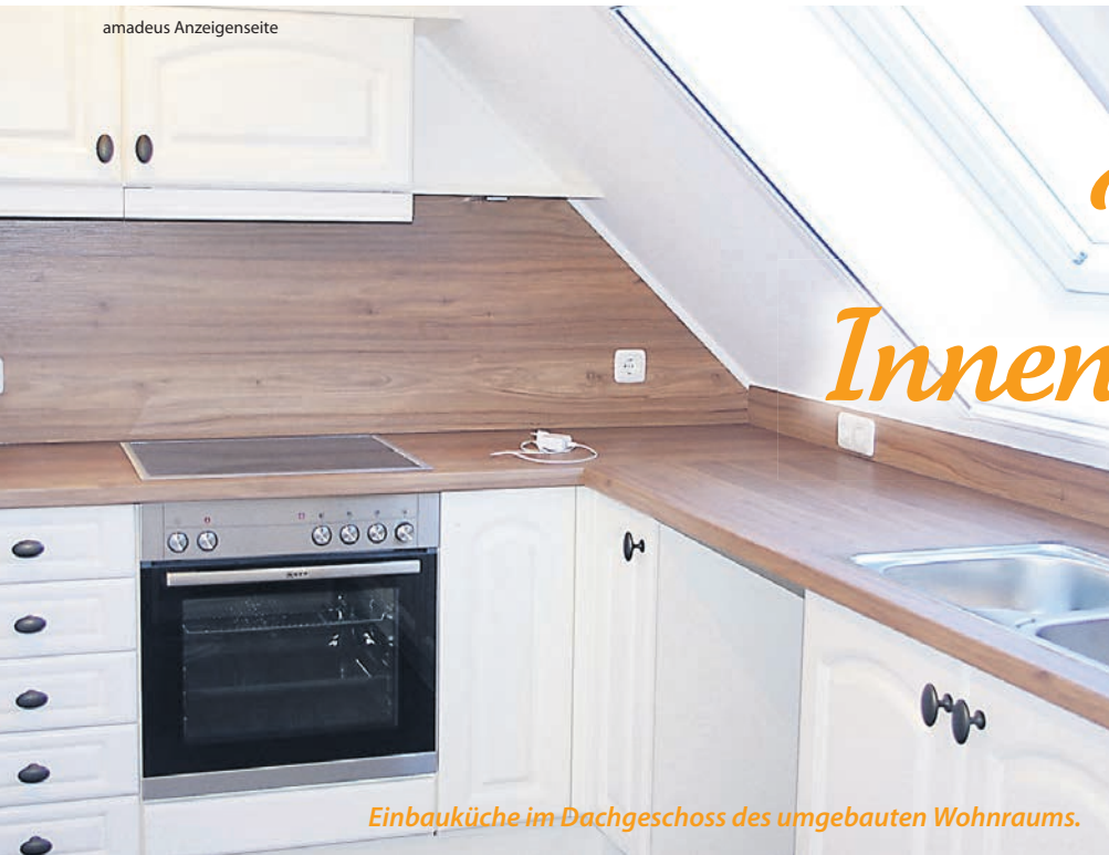
Einbauküche im Dachgeschoss des umgebauten Wohnraums.