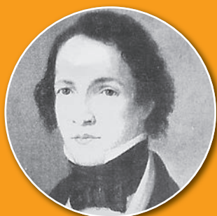
Johann Kaspar Zeuß